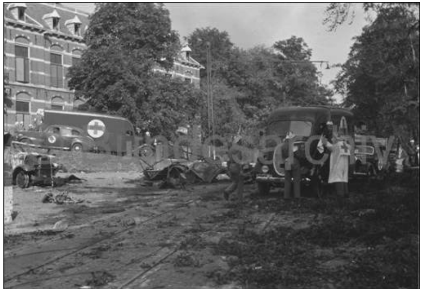
Fotoserie: 19 september 1944. De evacuatie van het St. Elisabeths Gasthuis werd door Duitse militaire fotografen vastgelegd ter hoogte van het Gemeentemuseum aan de Utrechtseweg