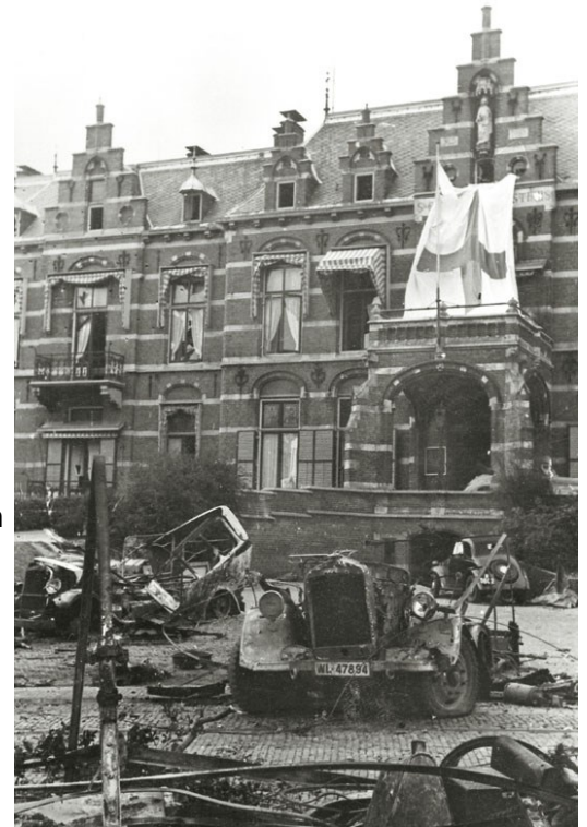
foto: September 1944, de sporen van de gevechtshandelingen rond het St. Elisabeths Gasthuis zijn duidelijk te zien. Een Duitse fotograaf legt het tafereel vast.