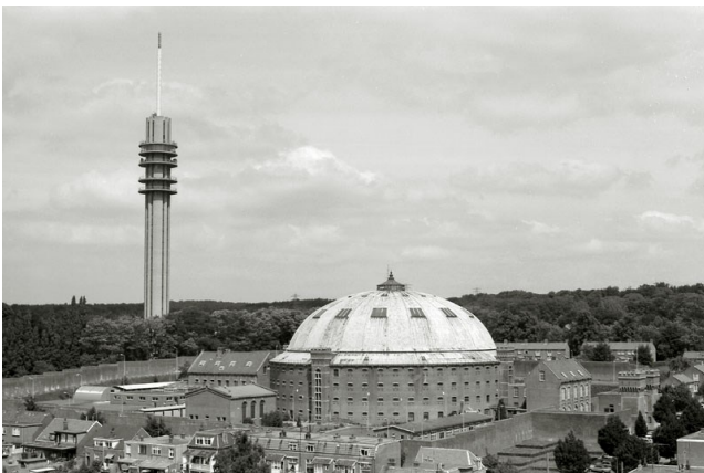
Naoorlogse luchtfoto van de Koepelgevangenis.