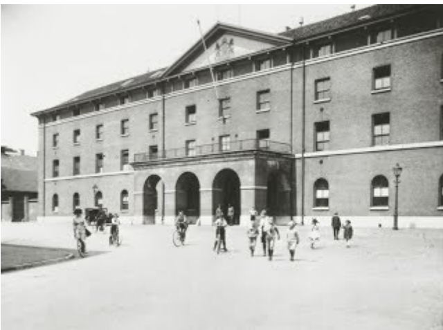
Vooroorlogs beeld van de Willemskazerne aan het Willemsplein