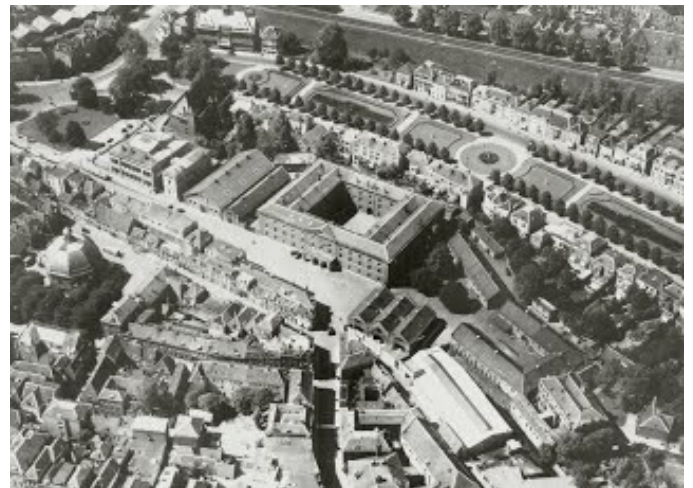
Vooroorlogse luchtfoto van de Willemskazerne en omgeving.

Een geallieerd bombardement op zondagochtend 17 september 1944 betekende het begin van een veranderd stadsbeeld in de Gelderse hoofdstad. Dit was echter niet het eerste bombardement op Arnhem tijdens de Tweede Wereldoorlog. Op 22 februari 1944 had de Amerikaanse 446th Bomb Group bij vergissing de gasfabriek en de verf- en glasfabriek van Van Ommeren zwaar getroffen. Zeventien huizen werden verwoest en nog eens eenentwintig anderen raakten zwaar beschadigd. In totaal kwamen 57 mensen om het leven.