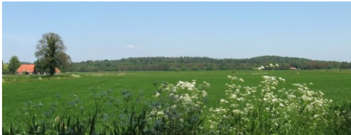
Vanuit het laaggelegen veengebied is het silhouet van de Lochemse berg te zien in de vorm van een kamelenrug met verschillende bulten.

Toegegeven, het klinkt nogal overdreven om een verhoging in het landschap van nog geen 50 meter 'berg' te noemen. Toch heten dit soort heuvels in Nederland nu eenmaal 'berg', of het nu de Holterberg, de Markelose berg of de Lemelerberg is. Allemaal zijn ze ontstaan door opstuwing van de bodem door bewegend landijs tijdens de ijstijd.