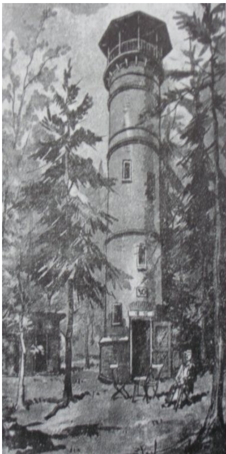
Op het hoogste punt van de Lochemer berg is in 1893 op initiatief van het Lochemse Verfraaiingsgezelschap een stenen uitzichttoren verrezen: de Belvédère. Vanwege de hoge bomen en onbetrouwbare trappen biedt deze allang geen uitzicht meer over de omgeving.

De Paasberg, aan de rand van Lochem gelegen, werd in de loop der tijd steeds meer opgenomen in de stadsuitbreiding. De Lochemer en de Kale berg waren van oudsher in gebruik als gemeenschappelijke markegronden, met hei en hakhout op de hoger gelegen delen en landbouwgrond op de flanken: de enken. Het beboste gedeelte is natuurgebied gebleven, sinds 1934 voor het grootste gedeelte onder beheer van Geldersch Landschap. Dat houdt het afwisselende karakter van het landschap in stand. In de bossen is het een beheer gericht op natuurwaarden, houtproductie en belevingswaarde. Daardoor ontstaat een bos met een goede, rijke ondergroei en verschillende boomlagen, maar ook met daartussen oude, dikke bomen. Tussen de bossen in ligt het accent op de landschappelijke waarden en natuurwaarden. Hier ligt een kleinschalig agrarisch landschap met houtwallen.