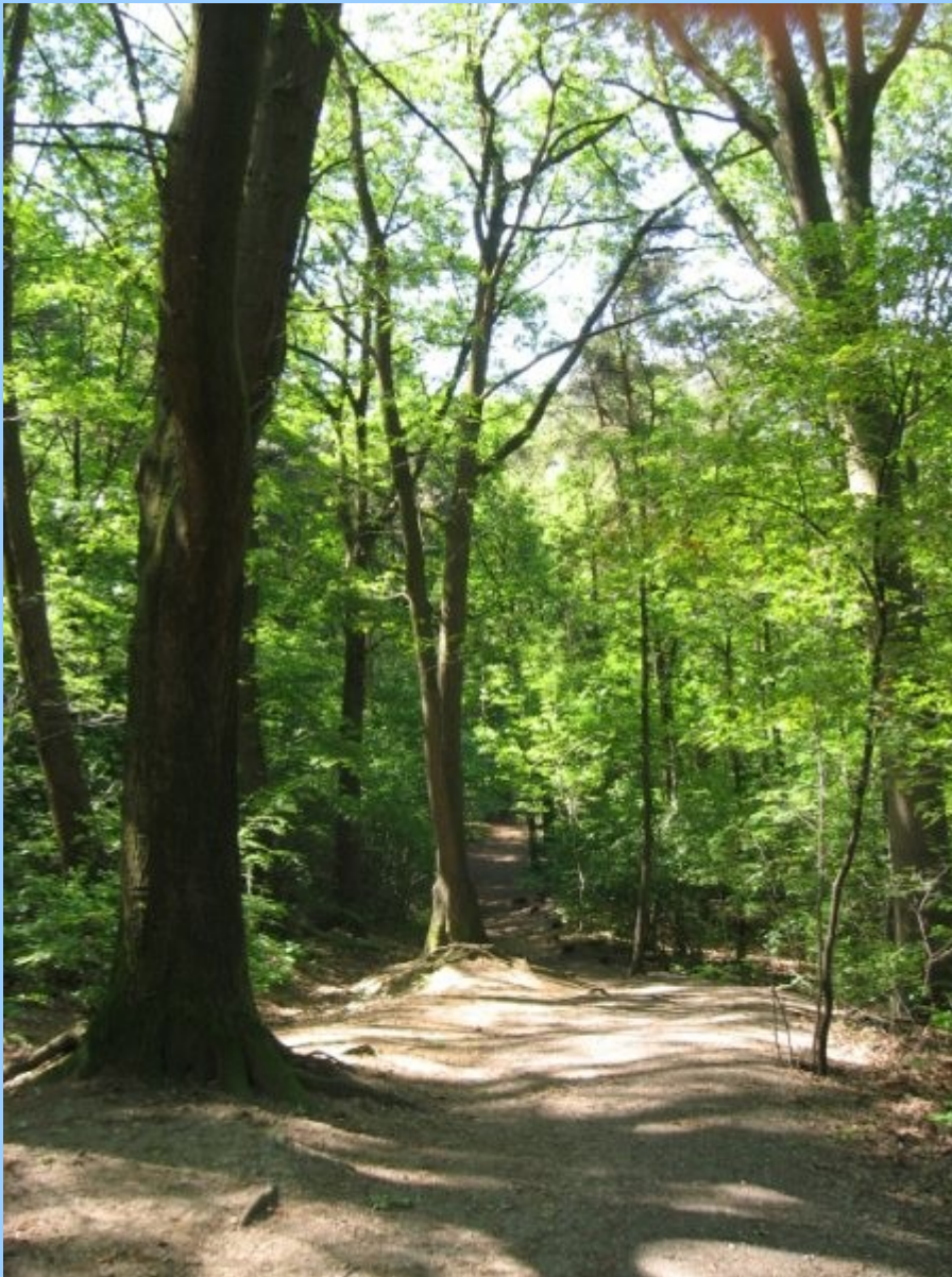
Gevarieerd bos op soms steile hellingen.

Frederik W. van Eeden, de vader van de gelijknamige literator en idealist, publiceerde in 1871 het boekje 'De Lochemse berg en zijne omgeving'. In 1984 werd het opnieuw uitgegeven door Boekhandel Lovink te Lochem. In dat boekje beschrijft van Eeden de ruime omgeving van de Lochemse berg, inclusief de talloze planten die hij aantreft, hun namen en de herkomst daarvan. Soms bewandelt hij zijpaden, zoals in een tirade tegen loslopende honden. Een speciale ode wijdt hij aan de Germaanse eik ( Querus pendunculata ), "de prachtigste van alle eiken en een boom met een geweldig, diep ontzagwekkend uiterlijk", zoals naar zijn zeggen "noch de Baobabs van Afrika, noch de heilige vijgenbomen van Indië, noch de Eucalypten van Australië, noch de reuzendennen van Amerika" dat hebben.