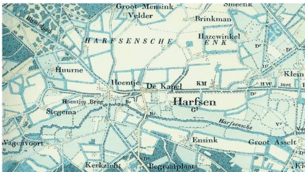
Het dorp Harfsen lag van oorsprong niet waar we het tegenwoordig vinden, maar daar waar Harfsensesteeg, Kapelweg en -dijk en Deventerdijk elkaar ontmoeten. De boerderijnamen van toen zijn niet allemaal meer in gebruik.

In Almen moeten veel olmen oftewel iepen gestaan hebben. Barchem is huis/woonplaats (hem, heem) bij de berg. Ook Lochem is een 'hem', maar dan bij een bosje op hoge zandgrond (lo, loo), al zien sommigen er ook 'look' (plant) in. Laren komt van 'laar', intensief gebruikt bos. Bij Gorssel (in 1275 als Gerslo vermeld) zou het gaan om 'gers' (gras) en 'lo'. De (wacht)toren in het Gorsselse wapen is overigens op een andere, foutieve, verklaring gebaseerd; zie GEMEENTE LOCHEM (30).