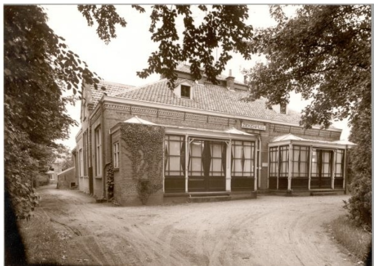
Het ziekenhuis aan de Zwiepseweg in zijn beginperiode.

Tot 1979 heeft het ziekenhuis gefunctioneerd met een capaciteit van 80 bedden. Nu staat er verzorgings- en verpleeghuis De Hoge Weide. De polikliniek is nog steeds in functie, nu als 'buitenpost' van het Spitaal in Zutphen.