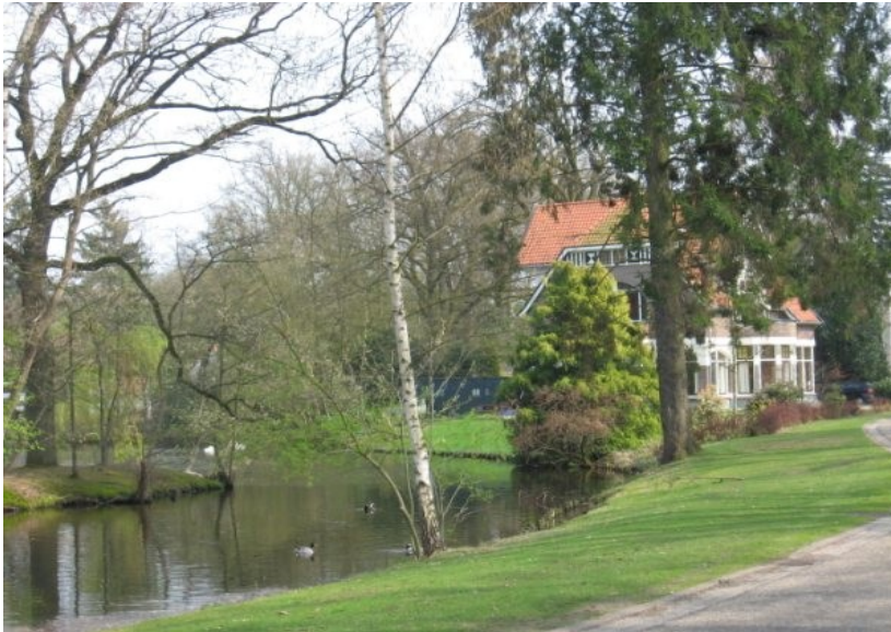
Berkeloord, Lochems goudkust uit het begin van de twintigste eeuw.