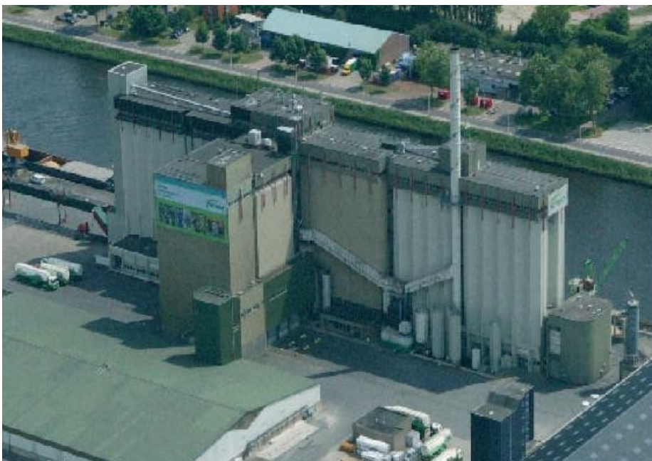
Wie Lochem nadert kan de gebouwen van ForFarmers bijna niet missen.

waarbij plaatselijke maalderijen en depots werden samengevoegd tot grotere eenheden. Zo ontstond ook in de noordelijke Achterhoek de behoefte een nieuwe gecentraliseerde moderne veevoederfabriek aan het water te bouwen. Aan het Twentekanaal in Lochem werd in 1979 de nieuwe ABC fabriek geopend, tegenwoordig ForFarmers geheten en onderdeel van de 'Coöperatie Koninklijke Cebeco Groep UA'.