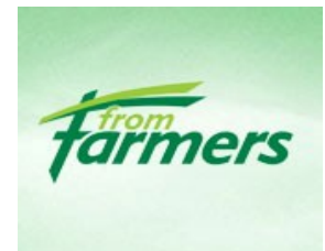
FromFarmers is de Lochemse coöperatie die grootaandeelhouder is van ForFarmers.

Voor boeren die samen hun zuivel afzetten, was het een logische stap om ook samen grondstoffen en hulpmiddelen aan te kopen. Eerst nog via de zuivelcoöperatie, maar al snel via een aparte aankoopcoöperatie 'de Graafschap'. Ook daar vond fusie na fusie plaats. Al in 1899 was het coöperatieve 'Centraal Bureau' opgericht met als taak om lokale boerenaankoopverenigingen te ondersteunen bij hun aankoop van meststoffen. In de jaren twintig ging het zich tevens bezighouden met de handel en productie van veevoerders en eind jaren dertig met de levering van machines. Zeventig jaar later gingen steeds meer lokale coöperaties rechtstreeks opereren onder de vlag van inmiddels 'Cebeco-Handelsraad',