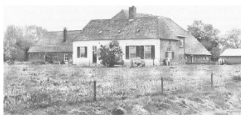
◀ Boerderij 't Klooster, situatie omstreeks 1982. De linker aanbouw is inmiddels gesloopt.

Door allerlei privileges en schenkingen ontwikkelde het klooster Bethlehem zich tot een belangrijk instituut dat van grote invloed is geweest op de geestelijke, economische en demografische ontwikkeling van Doetinchem.