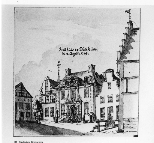
afbeelding stadhuis 1727

Op de Markt (nu Simonsplein) stond het prachtige 18 e eeuwse stadhuis van Doetinchem, ongeveer op de plaats waar in 2009 Hotel De Graafschap gevestigd is. Tijdens het bombardement van 21 maart 1945 is het grotendeels verwoest.