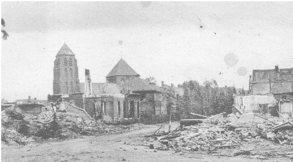
Hoek Terborgseweg/Wilhelminastraat na bombardement 21 maart 1945

waterleidingen waren gesprongen en tot overmaat van de ramp kon de brandweer niet uitrukken omdat ook de kazerne en de gemeentewerken waren getroffen. Houten balken die uit de verwoeste huizen waren gehaald en tegen de toren van de historische Catharinakerk waren gezet vatten vlam en zetten de toren in lichter laaie. Om 01.00 uur viel de brandende torenspits als een fakkel in het schip van de kerk. Dit alles met ontzetting gade geslagen door de nog aanwezige Doetinchemmers. Ook de hoek van de Wilhelminastraat (toen Thorbeckestraat geheten) en Terborgseweg werd door bommen getroffen. Hierbij werden de Groen van Prinsterer kweekschool en een aantal huizen verwoest. De kweekschool was op dat moment als noodhospitaal ingericht en daarvoor hadden de Duitsers er in september 1944 een laboratorium gevestigd. Of dit het doelwit is geweest of het even verderop gelegen treinstation is onduidelijk.