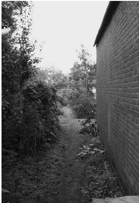
Restant van het Galgepad te Lienden Dit pad liep vanaf het Marktplein naar de Galgeplek (daar is nu woonwijk Kermestein).