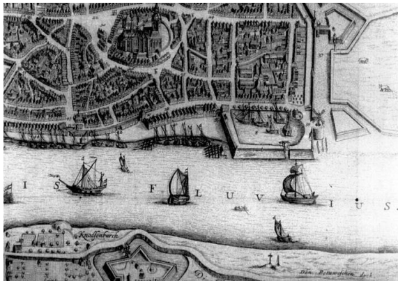
De Galgenplek van Lent ten westen van het voormalige Fort Knodsenburg

De ambtman van de Over-Betuwe sprak ook recht buiten de in de landbrief van 1327 genoemde 'heemsteden', zoals in Lent, dat een eigen rechtbank had. Volgens een oorkonde uit 1281 was er een 'iudex per Betuam': een rondtrekkende rechtbank die op diverse plaatsen rechtsprak volgens het Overbetuwse landrecht. Dat de ambtman in Lent een bank spande, was een uitvloeisel van oude heerlijkheidsrechten. Bijzonder aan de bank was, dat (in ieder geval in de zeventiende en achttiende eeuw) er ook geërfden in zitting hadden, die niet tot de ridderschap behoorden. Dat zal wel gelegen hebben aan het feit dat deze geërfden veelal aanzienlijke Nijmeegse stadsburgers waren. De terechtstellingen in Lent vonden plaats op een perceel in de Lentse uiterwaarden richting Oosterhout. Op de verhoging langs de Waal stond ook de tentoonstellingsgalg. De plek bevond zich op circa honderdvijftig meter voorbij het voormalige fort Knodsenburg. De stad Nijmegen heeft herhaaldelijk en met grote hardnekkigheid gepoogd om Lent geheel of gedeeltelijk onder haar jurisdictie te brengen. Eén van de argumenten was dat in het gebied weliswaar het Overbetuwse landrecht gold, maar dat men in beroep (klaring) diende te komen op het Valkhof. Een ander argument was dat de stad aanspraak maakte op een strook land langs de noordelijke Waaloever. Lent bleef echter Overbetuws rechtsgebied zonder vreemde inmenging.