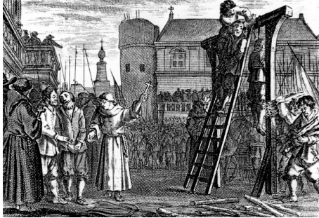
Opknoping aan de galg

Menig perceelsnaam in de Betuwe herinnert aan de macabere plek, waar voorheen een galg heeft gestaan, zoals Galgendaal, Galgenheuvel, Galgenberg, Halsaf. Omdat de tweede auteur op de Galgeplek in Elst woont, was het niet moeilijk hem enthousiast te maken om galgenplekken in de Betuwe te inventariseren. Met de Betuwe bedoelen we het gehele gebied tussen Rijn/Lek en Waal vanaf Herwen tot aan Culemborg-Gorinchem.