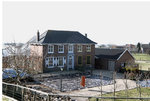
Het tegenwoordige Aspremont