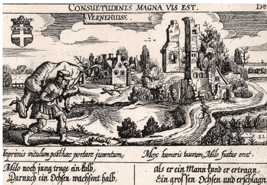
Een oude prent van Verhuizen