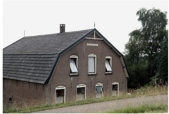
Het huis aan de dijk met opschrift Ver-Huizen

In de Betuwe was vroeger sprake van een aantal dorpjes, die niet meer als zodanig te herkennen zijn. Wie weet heden ten dage nog waar Wolferen, Opperden, Gesperden of Verhuizen lag? In dit verhaal wordt dieper op een van die dorpjes ingegaan, namelijk op Verhuizen, dat vroeger een belangrijke rol speelde. Haar belangrijkheid ontleende ze aan het feit dat er een veer lag. Het plaatsje was gesitueerd aan de dijk tussen Lienden en Ingen en slechts een straatnaam in Ingen – de Verhuizensestraat genaamd – en een huis aan de dijk met het opschrift 'Ver-Huizen' herinnert nog aan het dorpje.