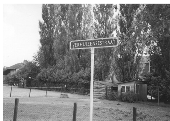
Stratnaambord in Ingen

Door het verdwijnen van het veer en het in verval raken van het kerkje, is het dorpje Verhuizen aan betekenis gaan inboeten en wordt niet meer op huidige kaarten genoemd.. Wat er nu nog van bekend is, is slechts een legende. Maar legendes blijven blijkaar langer in omloop dan de ware feiten, zo blijkt maar weer uit dit verhaal rond het weggespoelde Verhuizen en zijn Klokkewaai.