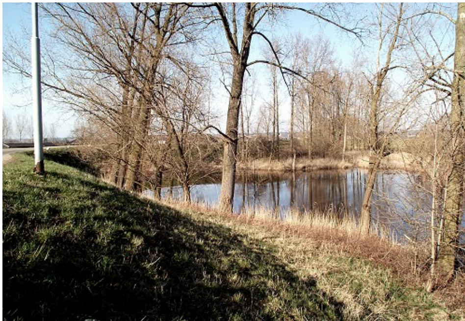
De Klokkewaai bij Lienden

Een legende verhaalt dat het dorpje van de kaart weggevaagd zou zijn door een geweldige overstroming ten gevolge van een dijkdorbraak. De kapel met zijn klok verdween in de diepe kolk die bij de doorbraak ontstond. De kolk of de waai kreeg daarna de toepasselijke naam van Klokkewaai (zie foto) en het verhaal wil dat op windstille zomeravonden vanuit de donkere diepte nog steeds kloggelui opklinkt.