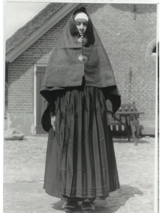
Foto 4: Vrouw van de Noordwest-Veluwe met een regenkleed over haar hoofd.

Gedurende de eerste zes weken, droegen de naaste vrouwelijke familieleden hun regenkleed over de arm (foto 3). Dit regenkleed, een grote zwarte doek gemaakt van sergie des dames, die sloot met twee zilveren gespen, werd tijdens de begrafenis over het hoofd gedragen (foto 4) door de vrouwen die op de lijkwagen zaten.