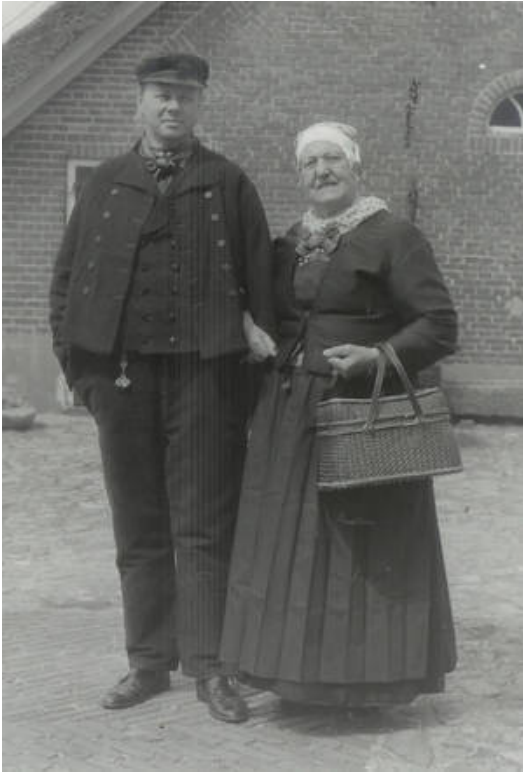
Foto 5: Opknappersgoed van de Noordwest-Veluwe omstreeks 1900, afrouwend. De vrouw draagt een paarsbonte tipmuts. In de doek, in het bovenstukje van het schort en in de strik is ook paars verwerkt. Het knoopdoekje van de man is bijpassend van kleur.

Door de weeks droegen de vrouwen een zwarte kraplap van tibet of ander materiaal. De doeken, die ze daarbij om hadden, waren van eenvoudiger materiaal dan die men 's zondags droeg. De rouwtipmuts, die bij de kerkdracht en het opknappersgoed dezelfde was, werd door de weeks, in tegenstelling tot 's zondags, met een bloot oorijzer dwz. zonder bovenmuts gedragen. De 'mouwen' (een jasje met driekwart mouwen dat deel uitmaakte van het opknappersgoed) werd tijdens de rouwperiode gesloten met een strikje in de kleur van de doek, die in die fase van rouw/afrouw gedragen werd (foto 5).