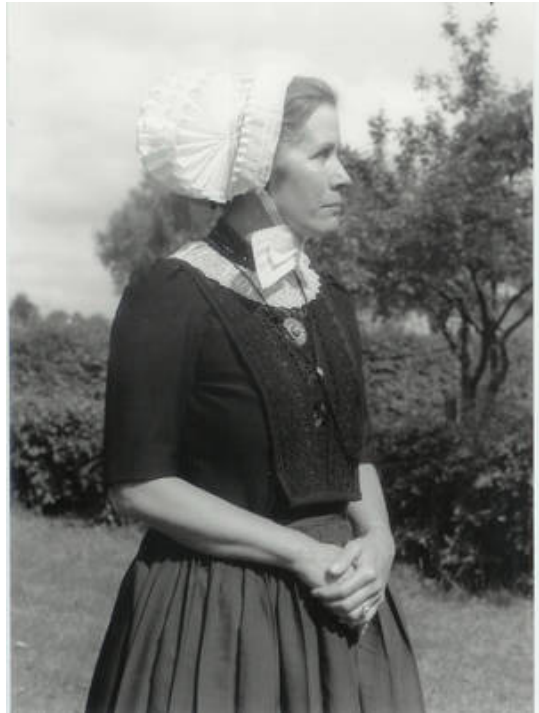
Foto 6: Driestroken muts met tulen voorstroken van de Noordwest-Veluwe voor de lichte rouw. De vrouw draagt een halsketting van vijf rijen gitten met een zilveren slot. Het schort is van kobaltkleurig tibet.

Na 1950 werd geen rouwcrêpe meer gebruikt. Bij het in de jaren twintig in zwang geraakte corsetpak (bestaande uit rok, lijf en ceintuur) draagt men tegenwoordig naar de kerk als teken van rouw alleen nog maar de tulen knipmuts. Deze wordt niet meer stijf geplooid, maar valt net als de knipmuts los over de schouders. Een enkeling gaat ook nu nog 's zondags in streekdracht naar de kerk. Plooi mutsen worden de laatste dertig tot veertig jaar op de gehele Noord-Veluwe niet meer gedragen.