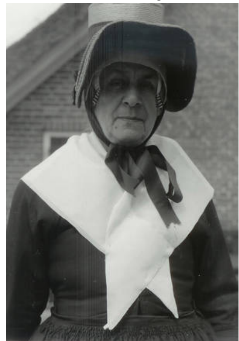
Foto 1: Vrouw van de Noordwest-Veluwe, gekleed in kerkdracht, zware rouw. De witte doek werd gedurende de eerste zes weken naar de kerk gedragen.

Op de Noordwest-Veluwe, waar tot begin van de vorige eeuw overwegend de oorijzerdracht gedragen werd, kende men een grote verscheidenheid in rouwkleding. Aan het 'afrouwen' werd uitgebreid aandacht besteed. Een insider kon meteen aan de doeken en de tipmuts zien in welke fase van het rouwproces men zich bevond. Op de Noordoost-Veluwe werd tot ca. 1850 nauwelijks streekdracht gedragen en oorijzers, noch het Veluwse, noch het Kamper oorijzer zijn daar voorgekomen.