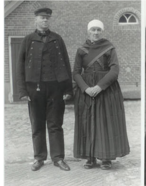
Foto 3: Man en vrouw van de Noordwest-Veluwe getooid in de kerkdracht die bij de eerste zes weken van zware rouw gebruikelijk was. Over de arm draagt de vrouw het regenkleed.

Zolang het zwart in de doeken overheerste, droeg de rouwende vrouw een zwartbonte tipmuts. Daarna kwam een paarsbonte die weer gevolgd werd door een blauwbonte. Over de tipmuts werd een rouwhul zonder kant gedragen en daar overheen een kiphoed met zwarte banden (foto's 1 en 3). In het bovenstuk van de schorten kwamen de kleur van de doeken en de motiefjes terug.